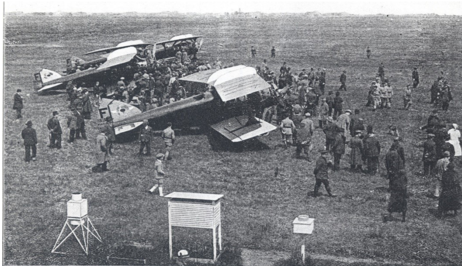
L'inauguration de la ligne Paris-Lyon-Marseille, le 30 mai 1926. Les Berlins venant de Paris viennent d'atterrir à Bron.

L'Air Ministry annonce que la station radiogoniométrique de Flamborough (lat. 54°07' Nord, long. 0°05' Ouest) ne fonctionne plus jusqu'à nouvel ordre.